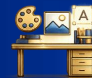
브랜드 디자인 고도화