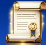
법률 자문 제공