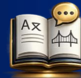
전문 번역 지원

글로벌 진출의 가교 역할을 하는 단계로, 전문 번역 브랜드 디자인 고도화, 현지 진출을 위한 법률 자문을 제공합니다.